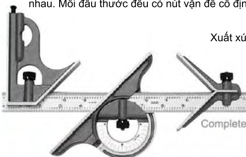
Xuất xứ: Nhật Bản

Được cấu tạo bởi 3 thành phần đo, lưỡi thước bằng thép không gỉ. Các thành phần được làm bằng các chất liệu tốt, cho phép làm việc ở các điều kiện làm việc khắc nghiệt. 2 thước đo ở 2 đầu có thể đo góc 90 độ và 45 độ. Thước tại vị trí giữa có thể đo được nhiều góc khác nhau. Mỗi đầu thước đều có nút vặn để cố định vị trí.