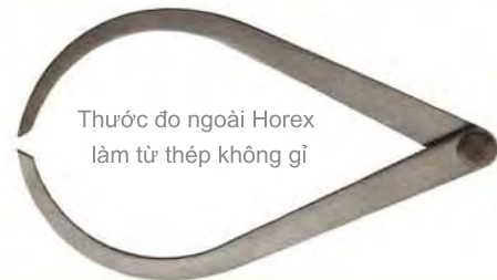
Thước đo ngoài Horex làm từ thép không gỉ